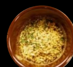
レモン シーズニング (粉末タイプ)