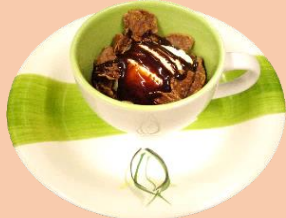
バニラアイス チョコソース