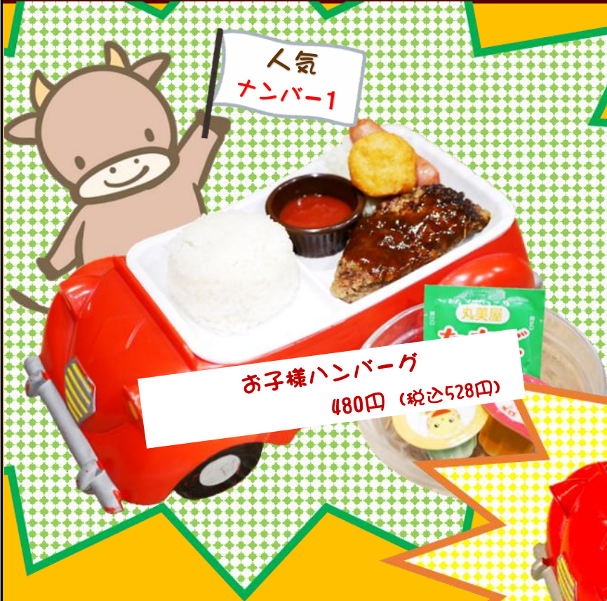
お子様ハンバーグ 480円(税込528円)