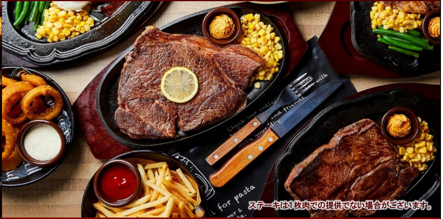
ステーキは1枚肉での提供でない場合がございます。

お冷・おしぼりは セルフサービス となります。 お手数ですが、セルフコーナーをご利用ください。