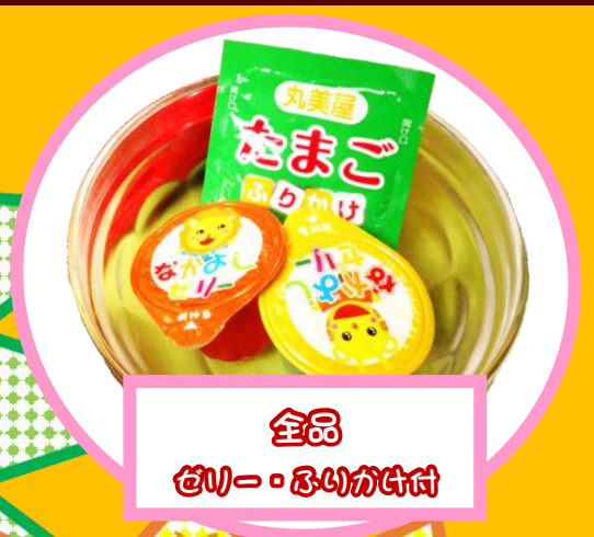
全品 セリ＝お取り分け付