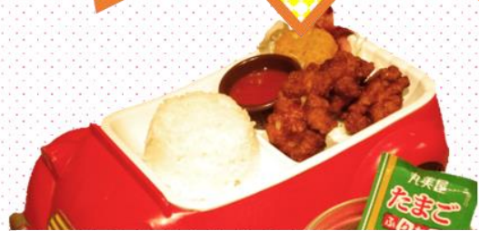
お子様からあげ 480円(税込528円)