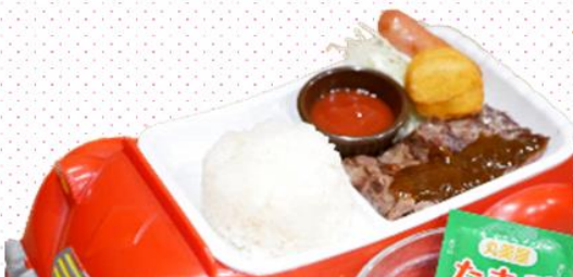
お子様ステーキ 480円(税込528円)