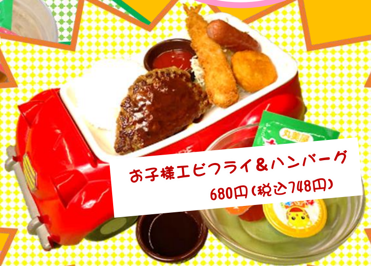
お子様エビフライ&ハンバーグ 680円(税込748円)