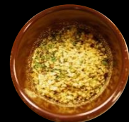
レモンシーズニング (粉末タイプ)