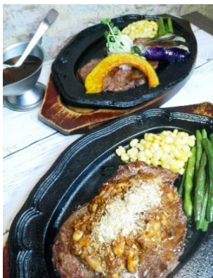
上-おろしポン酢ステーキ