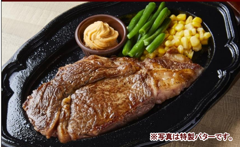
※写真は特製バターです。