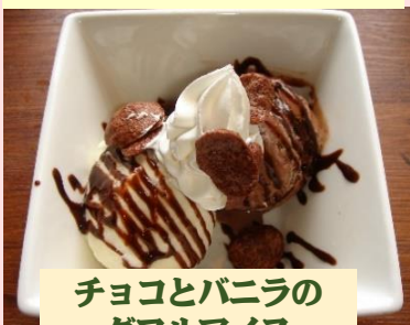
チョコとバニラの ダブルアイス