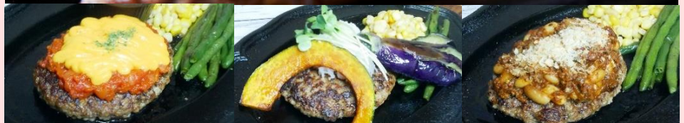
チェダーチーズハンバーグ