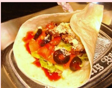
スパイシーミートタコス