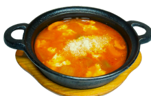
メキシカンスープ 380円 (税込418円)