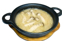
ガーリックスープ 380円 (税込418円)