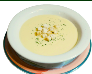
コーンスープ 380円 (税込418円)