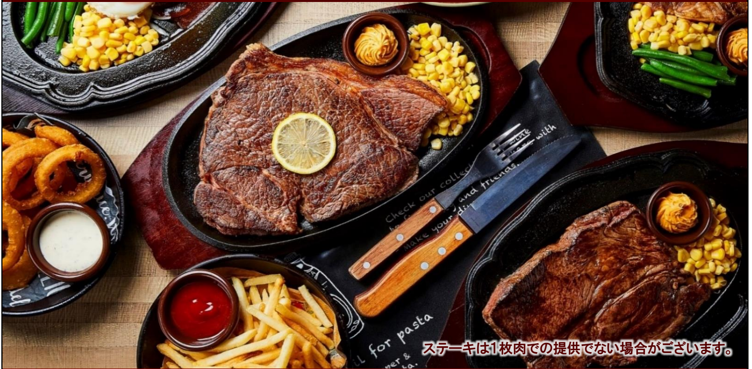
ステーキは1枚肉での提供でない場合がございます。

お冷・おしぼりは セルフサービス となります。 お手数ですが、セルフコーナーをご利用ください。