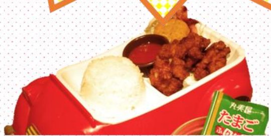
お子様からあげ 480円(税込528円)