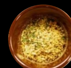
レモン シーズニング (粉末タイプ)