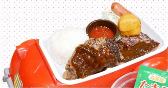
お子様コンビ (ステーキ&ハンバーグ) 680円(税込748円)