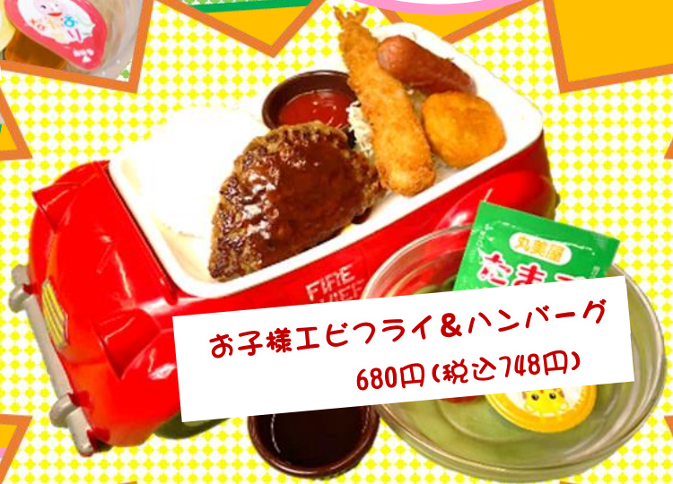
お子様エビフライ&ハンバーグ 680円(税込748円)