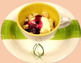
バニラアイス ベリーソース