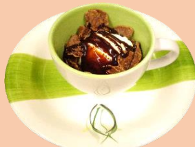
バニラアイス チョコソース