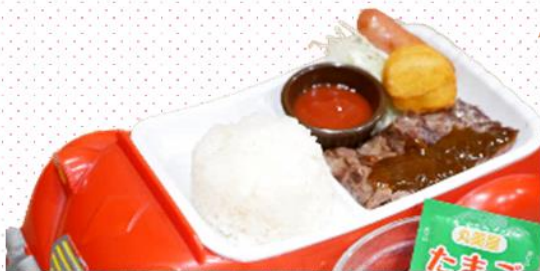
お子様ステーキ 480円(税込528円)