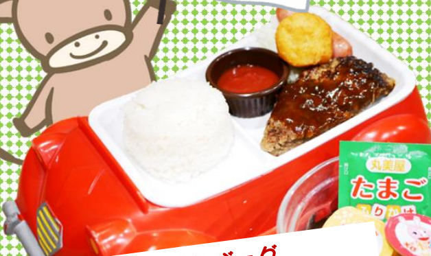
お子様ハンバーグ 480円(税込528円)