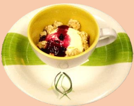
バニラアイス ベリーソース