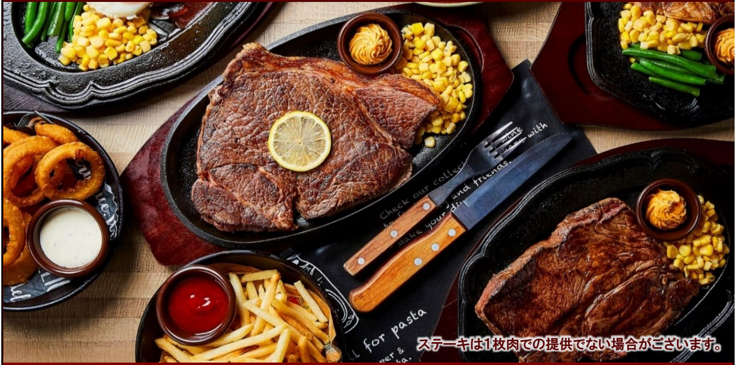
ステーキは1枚肉での提供でない場合がございます。

お冷・おしぼりは セルフサービス となります。 お手数ですが、セルフコーナーをご利用ください。