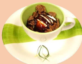
バニラアイス チョコソース